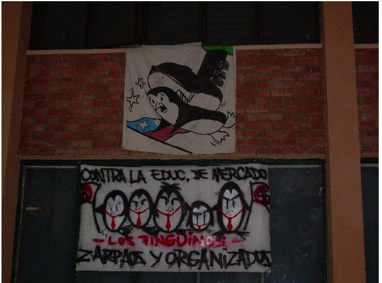
toma dario salas por cosmopolita Thursday, Jun. 08, 2006 at 6:37 PM