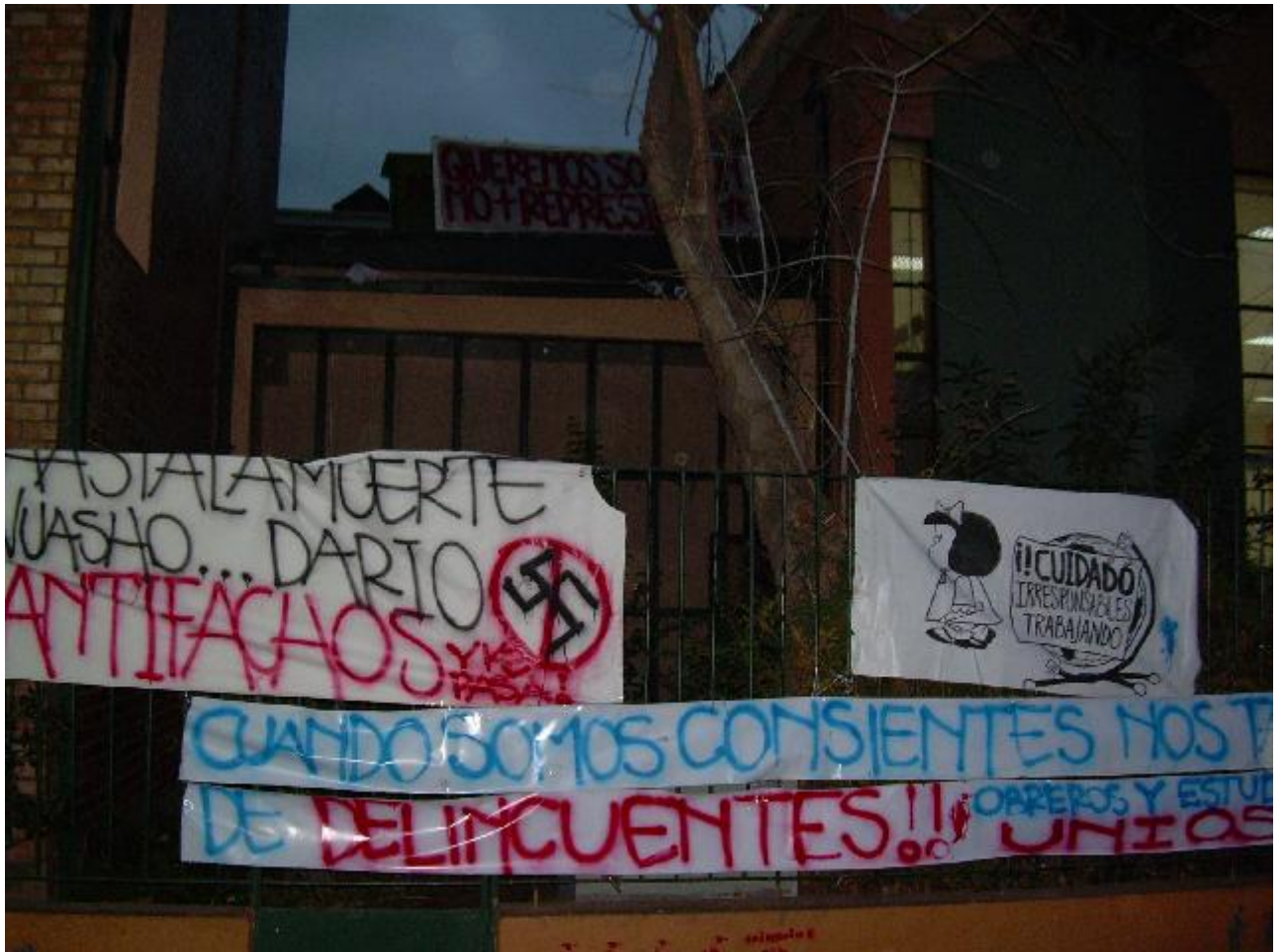
toma dario salas por cosmopolita Thursday, Jun. 08, 2006 at 6:37 PM