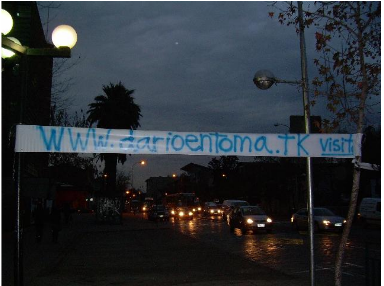
toma dario salas por cosmopolita Thursday, Jun. 08, 2006 at 6:37 PM