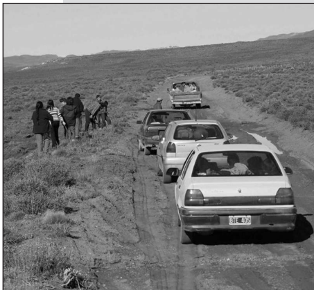
En la com isarñ N ° 14 de Ing. Jacobacci m im bros del CAI hablabaron sobre lo sucedido com el oficial

varias oportunidades com partió la m esa com quien le pidió que se identifique debido a que tienen conocidos com un.