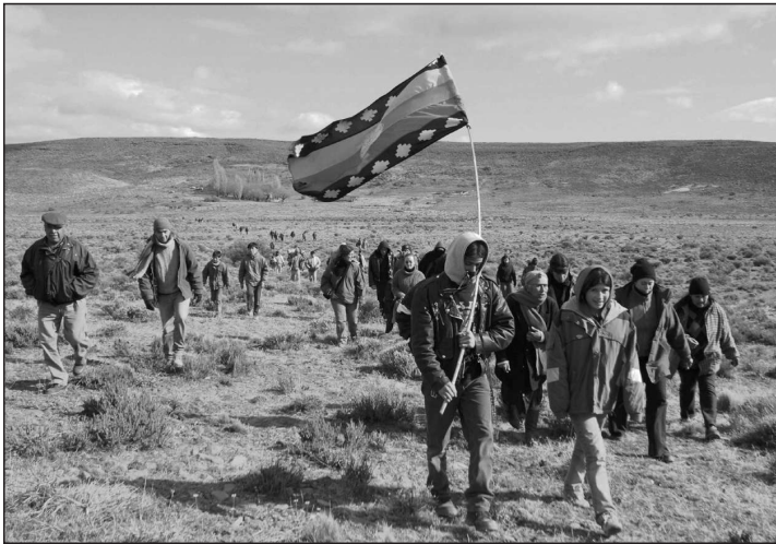
PARLAMENTO MAPUCHE EN QUETREQUILE, PUELMAPU