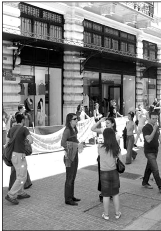
Acción de G ulumapu a favor del Pueblo Mapuche contra la multinacional Benetton en Girona, 2004.

Los temas que se tratarán en las sesiones de reunión y discusión serán entre otros: Educación Mapuche; Derechos humanos, la Lucha del Pueblo Mapuche frente a las multinacionales (Benetton, Indesna, en presas forestales...); Presos políticos y represión; Coordinación entre Mapuches en Europa y del territorio; G ulumapu y Puchunapu; Papel de los mapuches residentes en Europa en el apoyo a la lucha en el W ulmapu.