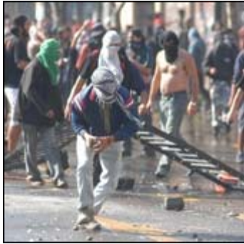
Imagen de archivo de las manifestaciones de estudiantes de la semana pasada

Con más de mil detenidos culminaron las protestas protagonizadas por los estudiantes secundarios en distintas ciudades del país, en una jornada que estuvo plagada de hechos violentos, con daños a la propiedad privada y pública e incluso cuatro carabineros heridos en Santiago.