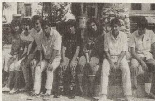
¿Que esperan del futuro?

ra inmediatamente advertir, que "por el contrario" en nombre de la "convivencia democrática" y de la "concertación social" existe la necesidad de asegurar una continuidad que elimine las percepciones de amenaza entre sectores sociales. Es claro que lo primero lo dicta la necesidad de apoyo popular, de sus votos. Lo que viene a continuación lo exige la caja, las finanzas, la verdadera alma del PDC. ¿Puede acaso el pueblo tener problemas para aceptar una estrategia de desarrollo que imponiendo cambios y reformas le asegure PAN, TECHO y TRABAJO? Más adelante el documento sostiene "que la convivencia democrática será nuevamente posible en Chile si los proyectos de transferencia reconocen los límites que impone el principio de gradualidad (subrayado nuestro), lo que a su vez sólo será viable si las clases sociales y sectores dominantes entienden que la coexistencia social con un razonable grado de armonía es incompatible con la inmovilidad de los privilegios". Hablar de un "principio de gradualidad", tanto para referirse a la satisfacción urgente de la necesidad de PAN, TECHO y TRABAJO que padecen millones de chilenos, como para referirse a la necesidad de poner fin a los privilegios de unos cuantos cientos de familias, no sólo es antipopular, sino anticristiano.