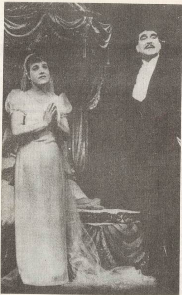
"La Opera de 3 centavos" en Berlín

títulos para celebrar también en Chile los 90 años del autor.