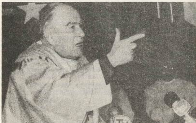
Cardenal Silva Henríquez

DEMOCRACIA Y VENGANZA : "La mejor manera de asegurar la futura democracia es abandonar toda clase de venganza contra los militares, incluido Augusto Pinochet".