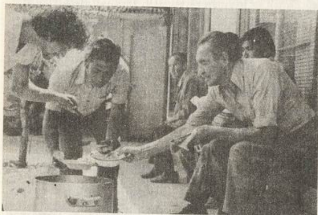
Ollas comunes: cara real

de amor a la patria, con la unidad de los chilenos y con la idea de que quedan aún muchas cosas por hacer para llegar a la meta de ser un país en desarrollo a fines del presente siglo. Todavía la propaganda no martilla llamando a votar por el "SI", pero crean las condiciones desde ahora a fin de desencadenar más adelante el bombardeo sobre un campo ya ablandado.