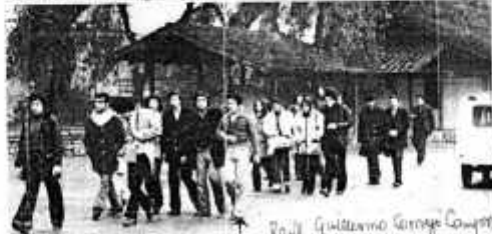
La fotografía presenta el instante que hacen abandono del campamento "Tres Alamos" las personas detenidas por su intento de asilarse en la ex Embajada de Bulgaria para impresionar a los cancilleres de la OEA reunidos en

Los detenidos en Tres Alamos, desde el día 11 de junio, son los siguientes: