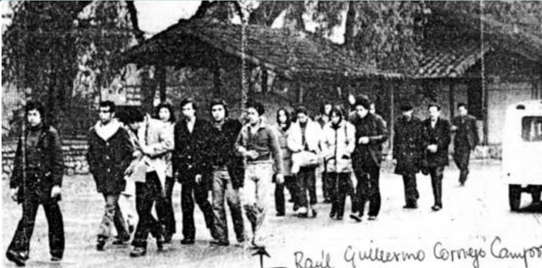
La fotografía presenta el instante que hacen abandono del campamento "Tres Alamos" las personas detenidas por su intento de asilarse en la ex Embajada de Bulgaria para impresionar a los cancilleres de la OEA reunidos en