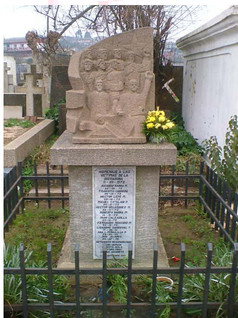
Escultura en homenaje a las víctimas de la dictadura Creada por Igor Reyes