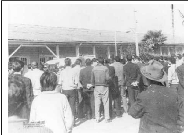
Comisaría de Tomé ubicada en la calle Egaña, actual Hospital de Tomé