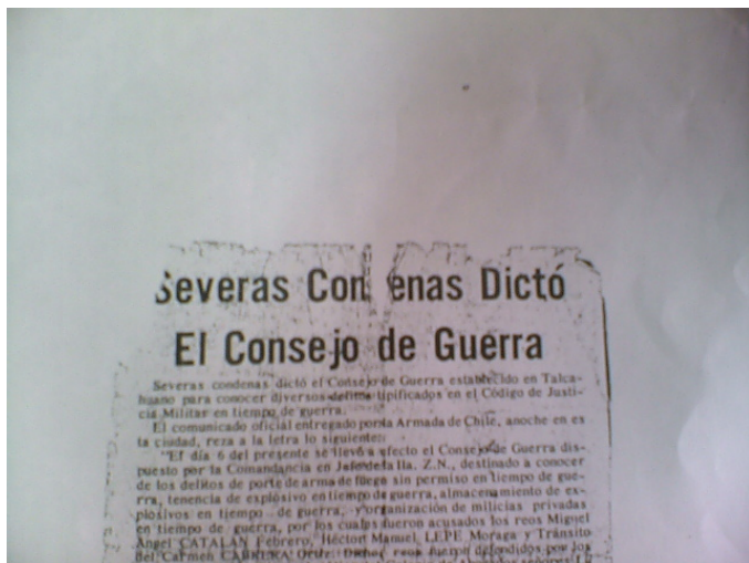
El diario El Color informa a la comunidad las primeras sentencias del Concejo de Guerra, en las que figuran los cuatro jóvenes del MIR

Diferentes diarios regionales señalan lo ocurrido en Tomé con respecto a los cuatro jóvenes miristas y sus sentencias. Extracto de Diario El Color