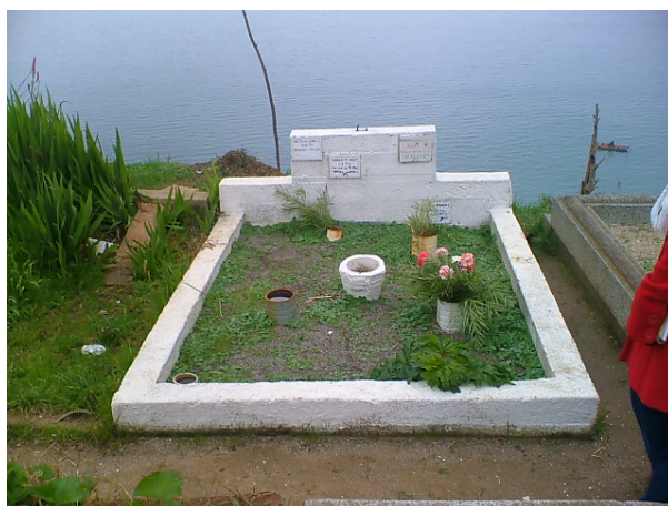
El cuerpo de Héctor Manuel Lepe Moraga se encuentra en el Cementerio 1 de Tomé