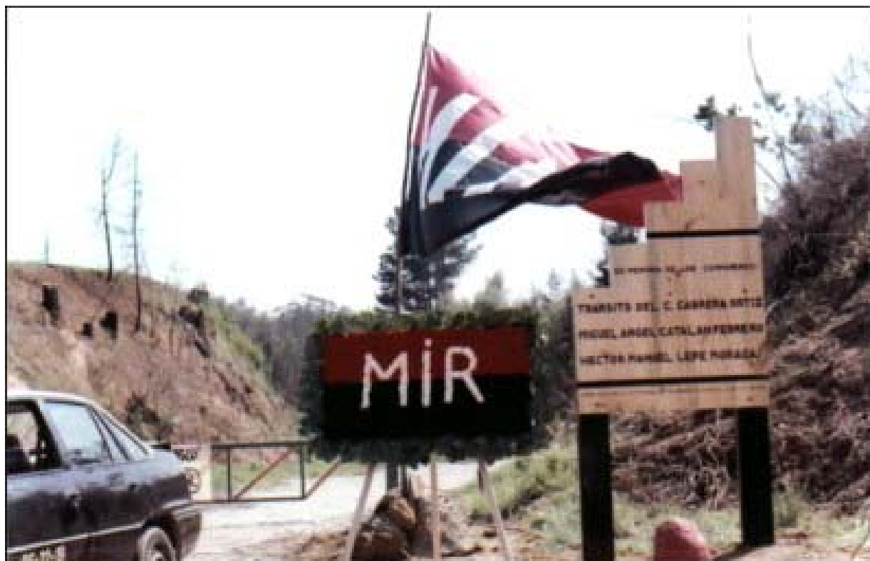
Memorial a los cuatro compañeros