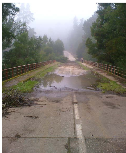
Puente Quebrada Honda