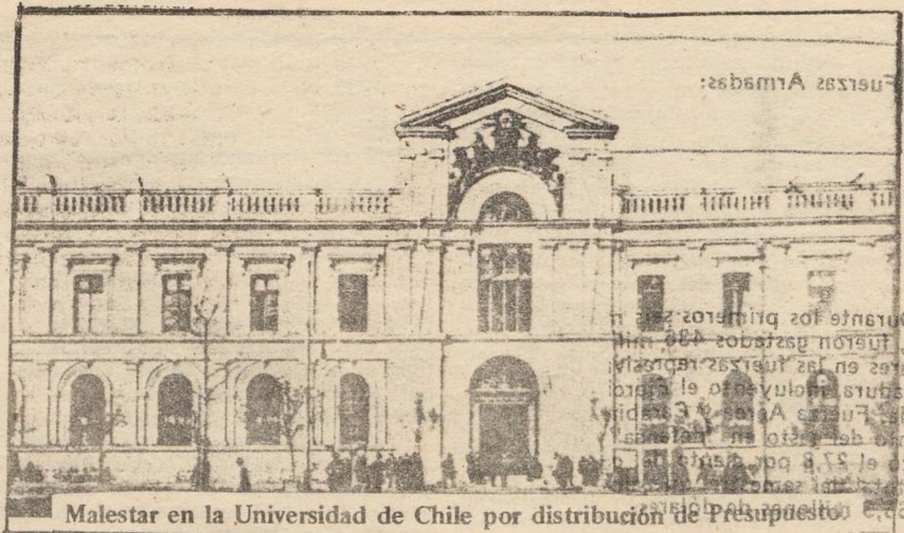
Malestar en la Universidad de Chile por distribución de Presupuesto

hiciera público el apresamiento de dos compañeros del MIR, encargados —según ellos— de la elaboración del periódico "El Rebelde". En una titular a toda página, afirmó que "un conocido periodista de la capital" colabora con el periódico y que la policía estaba tras sus pasos. Han pasado varias semanas y de ese "conocido periodista" nunca más se supo porque nunca existió en realidad y sólo se trató de una intentona por amedrentar a muchos periodistas que están siendo hostigados en los medios donde trabajan. Todo ello, en días previos a la realización del primer Congreso de esos profesionales en este régimen, donde pese a todas las presiones, se declaró unánimemente que en Chile no existe libertad de prensa.