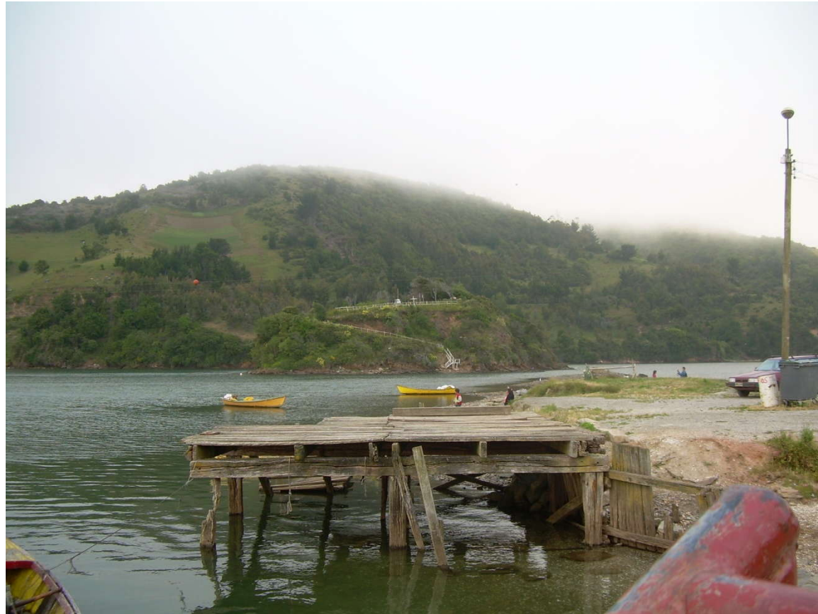
Caleta de Mehuín y al frente el territorio Mapuche de Misisipi