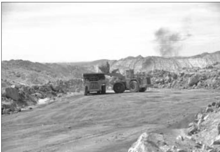
Figura 5. Camión en el frente de explotación.

al pueblo de Vergara, y observa la plaza con sus árboles caídos, y otros que aún resisten en pie, parados como “mástiles que dieron vida” –según algunos– al más hermoso de los pueblos salitreros del “grupo Toco” 25 , puede afirmar con un hálito evocativo: “aún están verdecitos”. Sin embargo, desde el cierre de Vergara éstos yacen en el abandono, muriendo inexorablemente, sin esperanzas, como el pueblo mismo. Están secos. El desierto hace rato los atrapó.