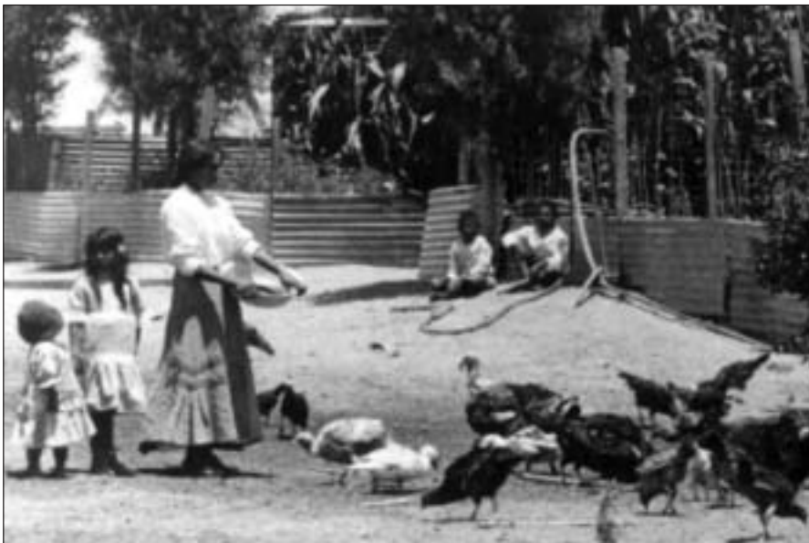
Figura 3. Mujer y pavos.

Ciertamente, esto nos aparta bastante del imaginario “clásico” de lo que “debería ser” la “vida pampina”. Asimismo, otro eje significativo de ruptura con el pasado está dado por la incorporación de las variables ambientales, tanto a los procesos productivos como en todo aquello que afecte la vida del campamento.