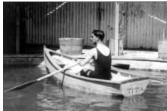
Figura 2. Hombre bogando en una pileta.

Salvando esta trompe l’oeil , tal vez lo único que quede de este imaginario sea el concepto pampino de una estoica lucha por afianzar un territorio que ya no existe, un imaginario que se afianza y sostiene a cuenta de jirones y fragmentos de memoria,