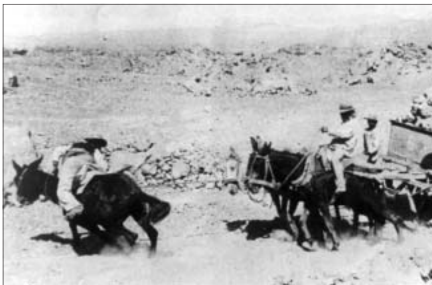
Figura 4. Carreta calichera.

Sabemos que la naturaleza para el antiguo pampino se establecía como una clara y feroz amenaza, como una entidad despiadada, que no transaba; hombre y naturaleza se encontraban en una lucha continua, en la que esta última se llevaba la mejor parte. El hombre peleaba con ella para extraerle su riqueza al precio de una constante batalla de desgaste, de su propio desgaste.