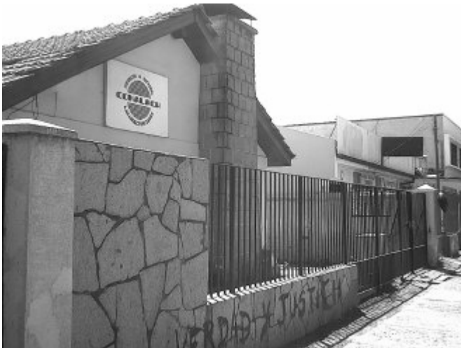
Nido 20, estado actual: Cortesía de Julio Oliva

A fines de marzo o a comienzos de abril de 1975, comenzó a utilizarse este recinto como centro secreto de detención y tortura. Agentes de la Dirección de Inteligencia de la Fuerza Aérea (DIFA) y civiles provenientes de grupos de extrema derecha actuaban en el Hangar de Cerillos . Este centro de detención fue formado para los trasladados de presos políticos del centro de detención y tortura Academia Aérea de Guerra (AGA) . Los testimonios dan cuenta de que se practicaba la tortura a todas horas: golpes, electricidad, privación de alimentos, colgamientos. Este centro de detención y tortura funcionó sólo por quince días y los agentes fueron trasladados hasta el local conocido como Nido 20