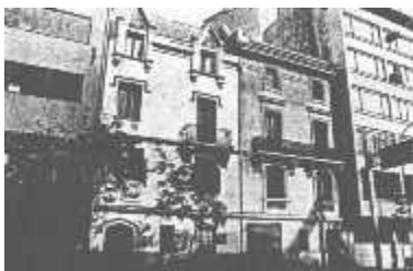
Clínica Santa Lucía . Clínica de la DINA - (Santa Lucía 160) - Santiago