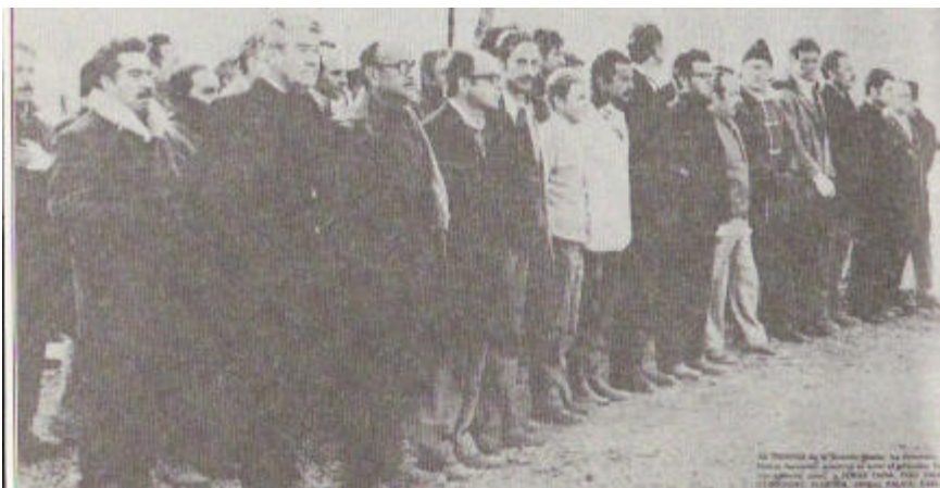
Prisioneros políticos en Isla Dawson, en formación

Isla Dawson esta ubicada en el extremo sur de Chile, en la provincia de Magallanes y servía de base para un campamento de ingenieros de la Armada. El 16 de septiembre de 1973, cinco días después del golpe de Estado, la Armada instaló en Isla Dawson los campos de concentración de Río Chico y Compingín . Cerca de 400 presos políticos de la zona fueron llevados al lugar, en donde debieron realizar trabajos forzados, que consistían en instalar postes, construir canales, extender alambradas y postes telefónicos. Trabajan también en un pantano sacando fango y vegetales en descomposición. Otros trabajos consistían en cargar camiones con piedras grandes, limpiar caminos, abrir zanjas y canales, acarrear ripio en sacos al hombro y al trote.