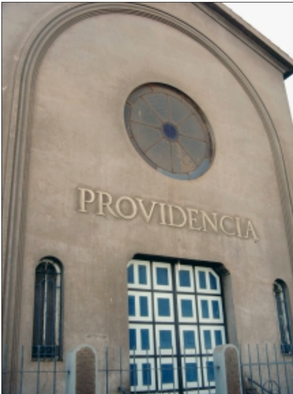
Iglesia ex Divina Providencia, II Región