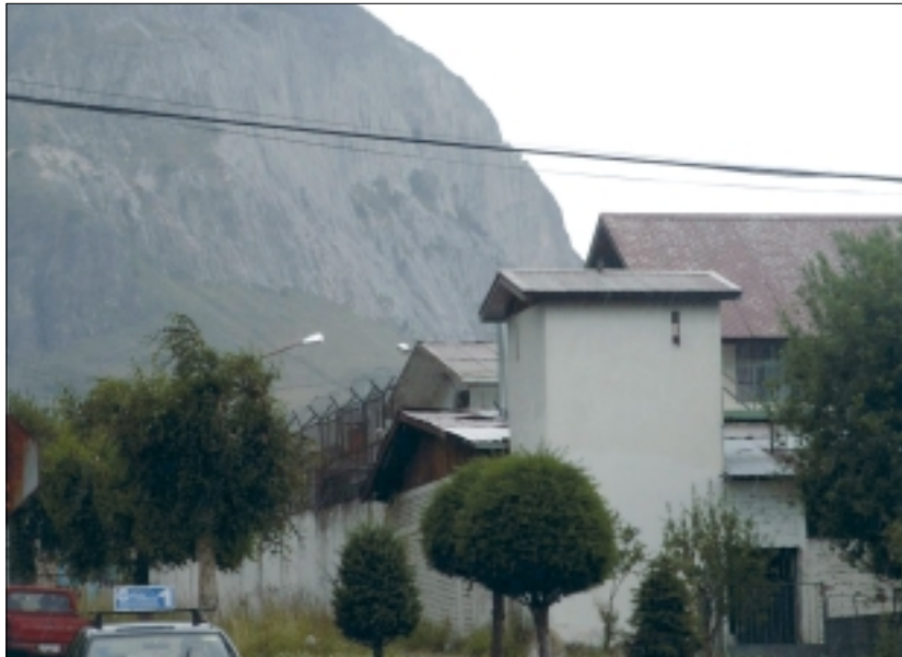
Cárcel de Coihaique, XI Región