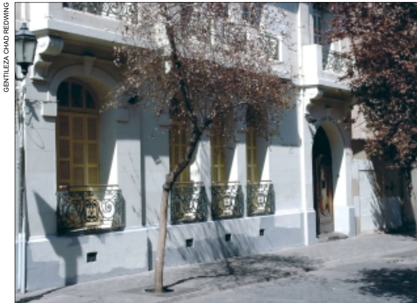
Londres 38, Región Metropolitana