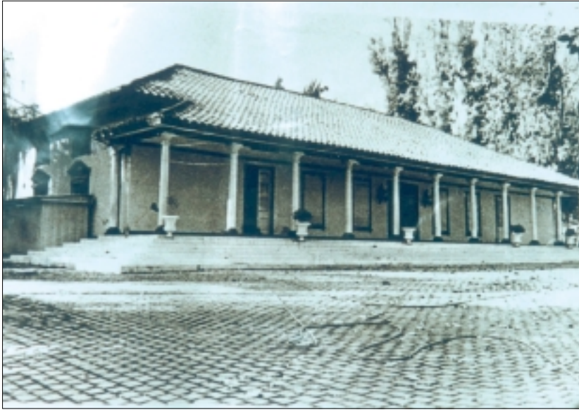
Villa Grimaldi, Región Metropolitana