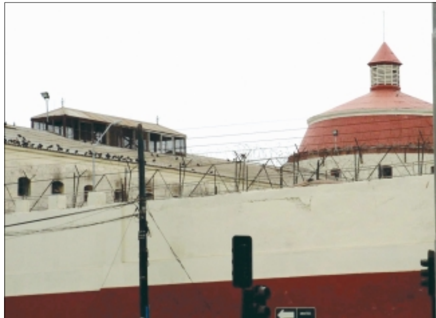
Cárcel de La Serena, IV Región