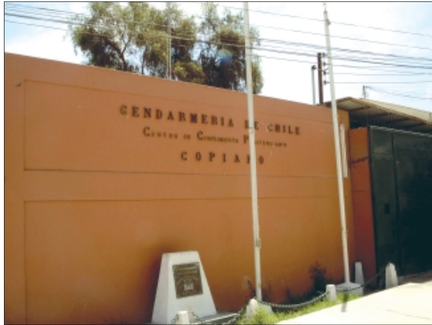
Cárcel de Copiapó, III Región