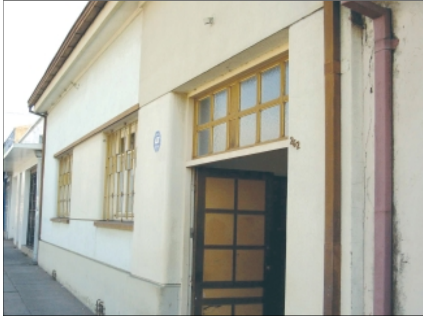
Casa Carrera Pinto en Parral DINA, VII Región