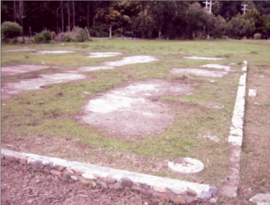
Ritoque, V Región