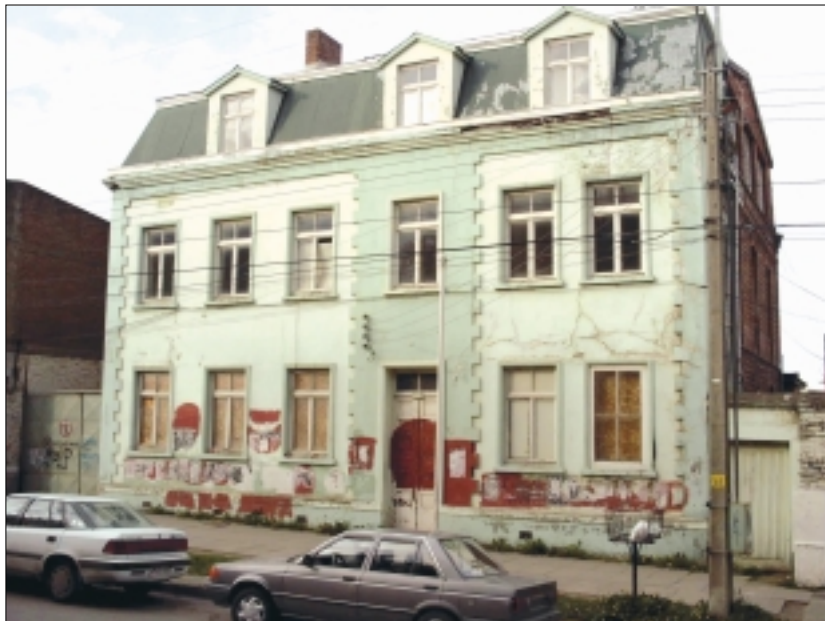
Palacio de las Sonrisas, XII Región