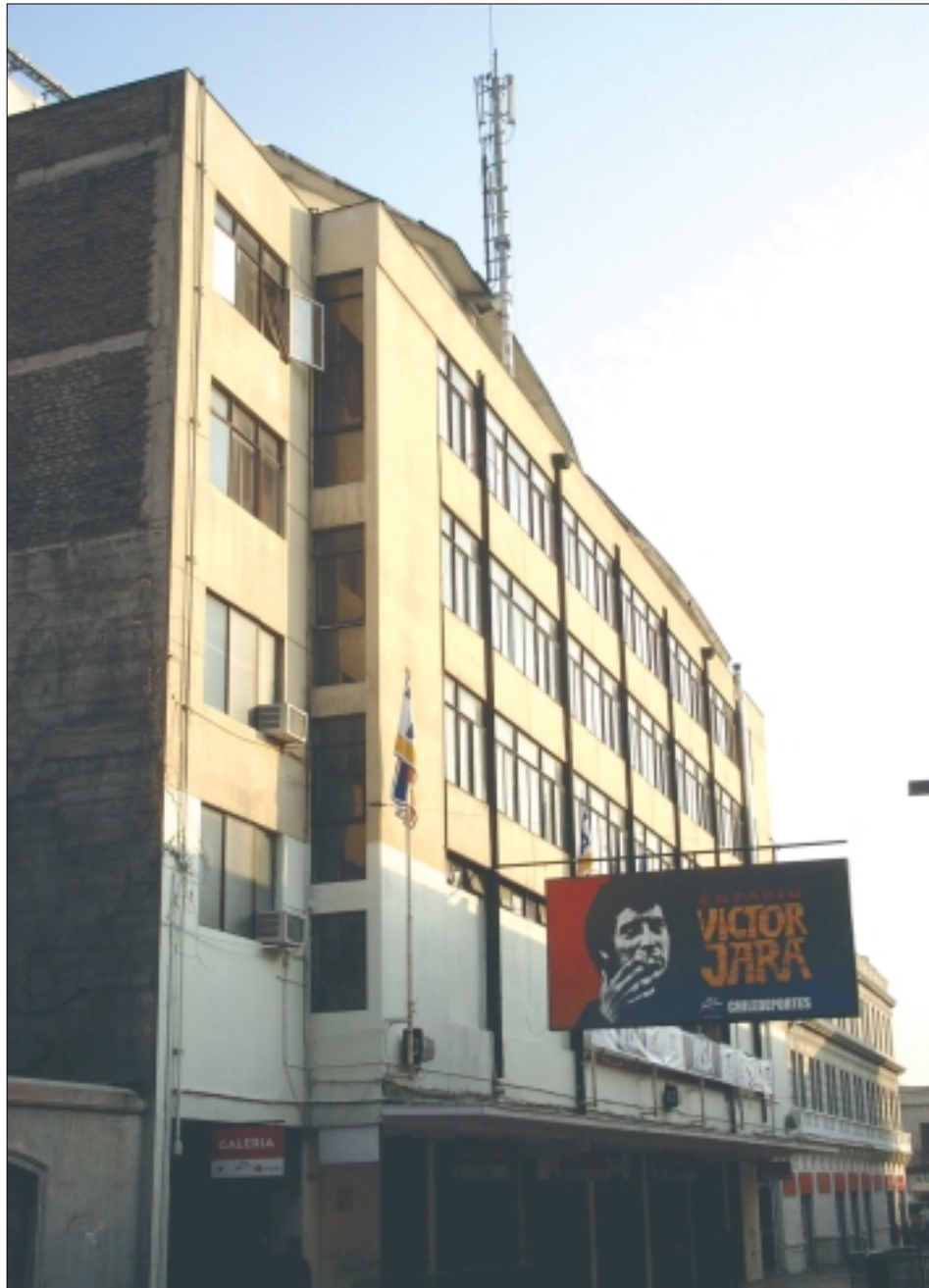
Estadio Víctor Jara (ex Estadio Chile), Región Metropolitana