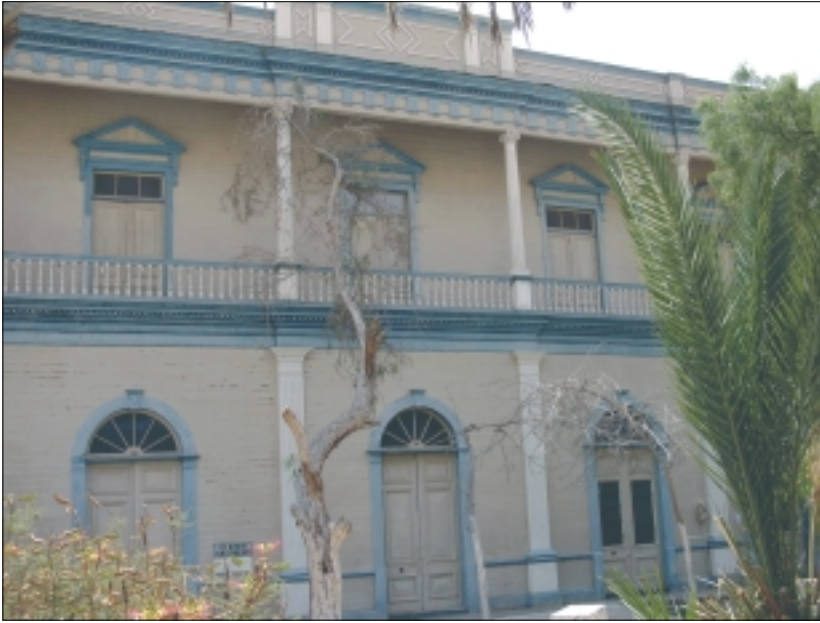
Pisagua, I Región