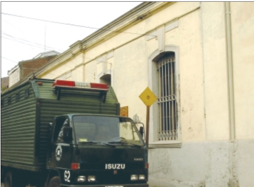
Cárcel de San Fernando, VI Región