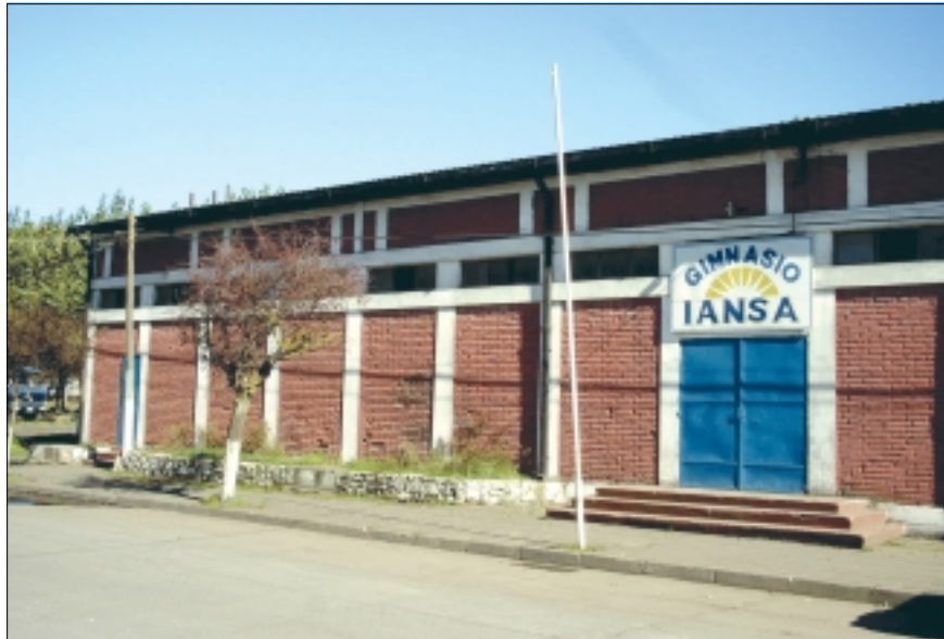
Gimnasio Iansa en Los Angeles, VIII Región