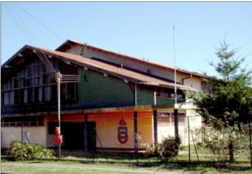
Gimnasio Cendyr Valdivia, X Región