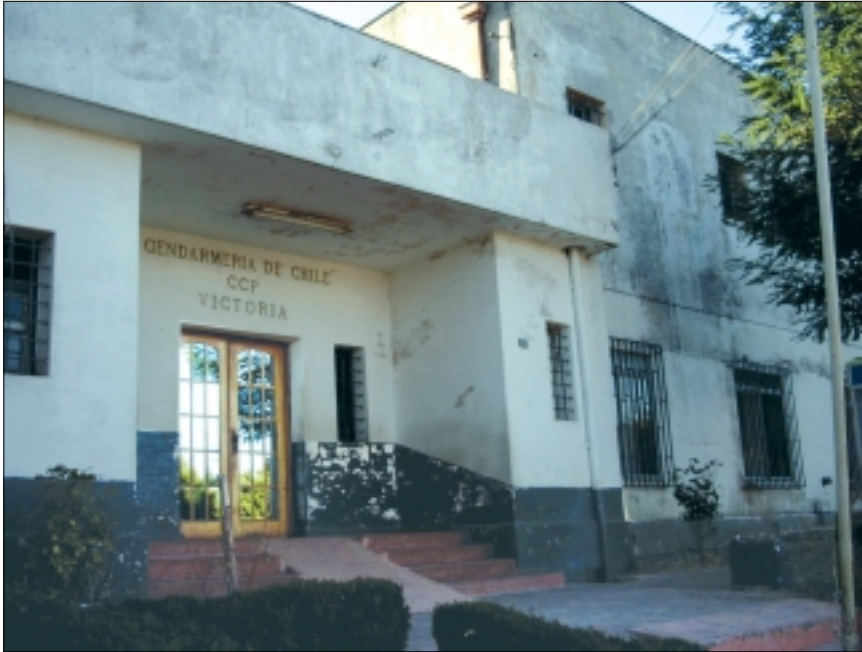
Carcel de Victoria, IX Región