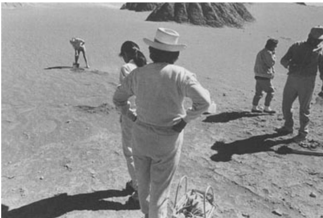
Búsqueda de los ejecutados en el Valle de la Luna. En varias ocasiones las Mujeres de Calama recorrieron diversos sitios de la región, a partir de datos sobre el paradero de sus familiares