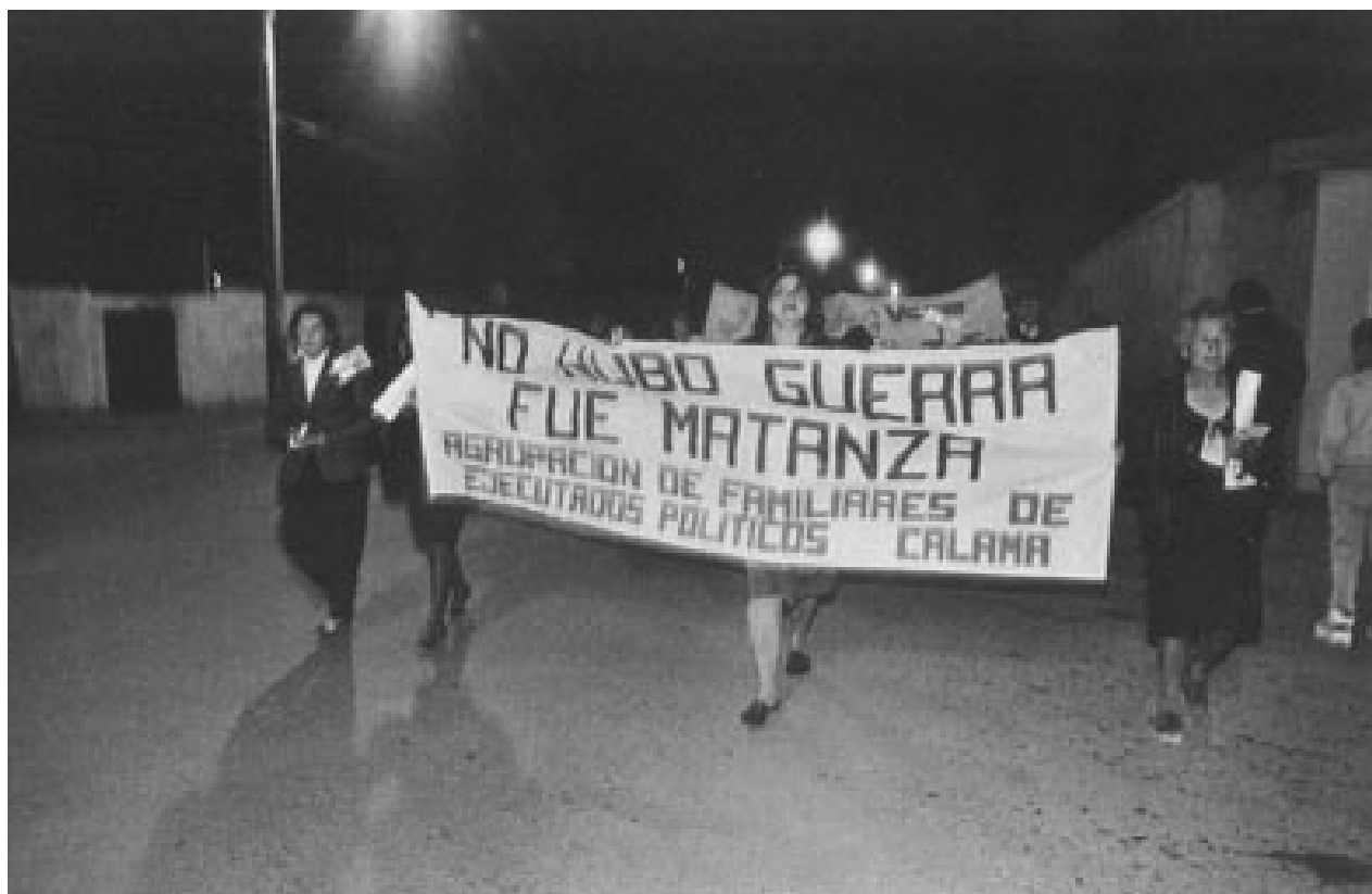
Las mujeres de Calama marchando en octubre de 1991