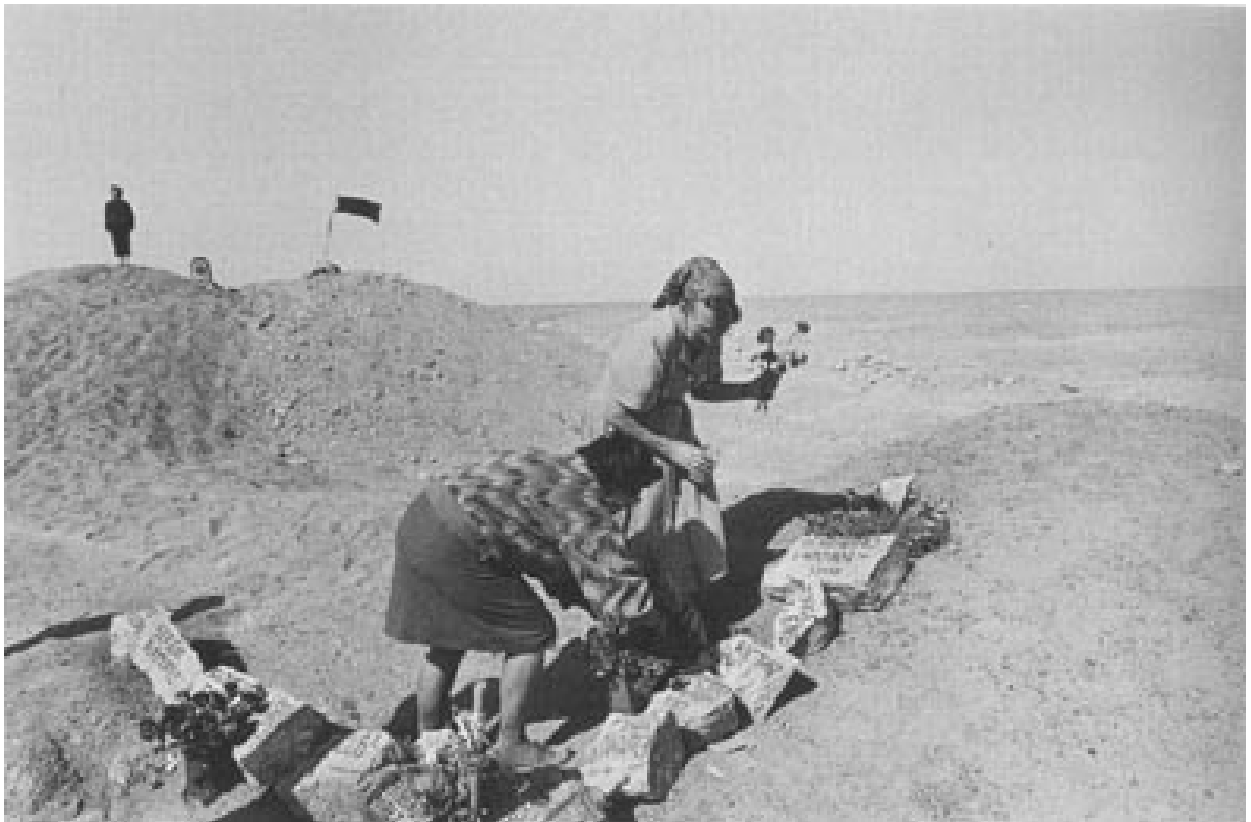
Mujeres depositando flores en la fosa