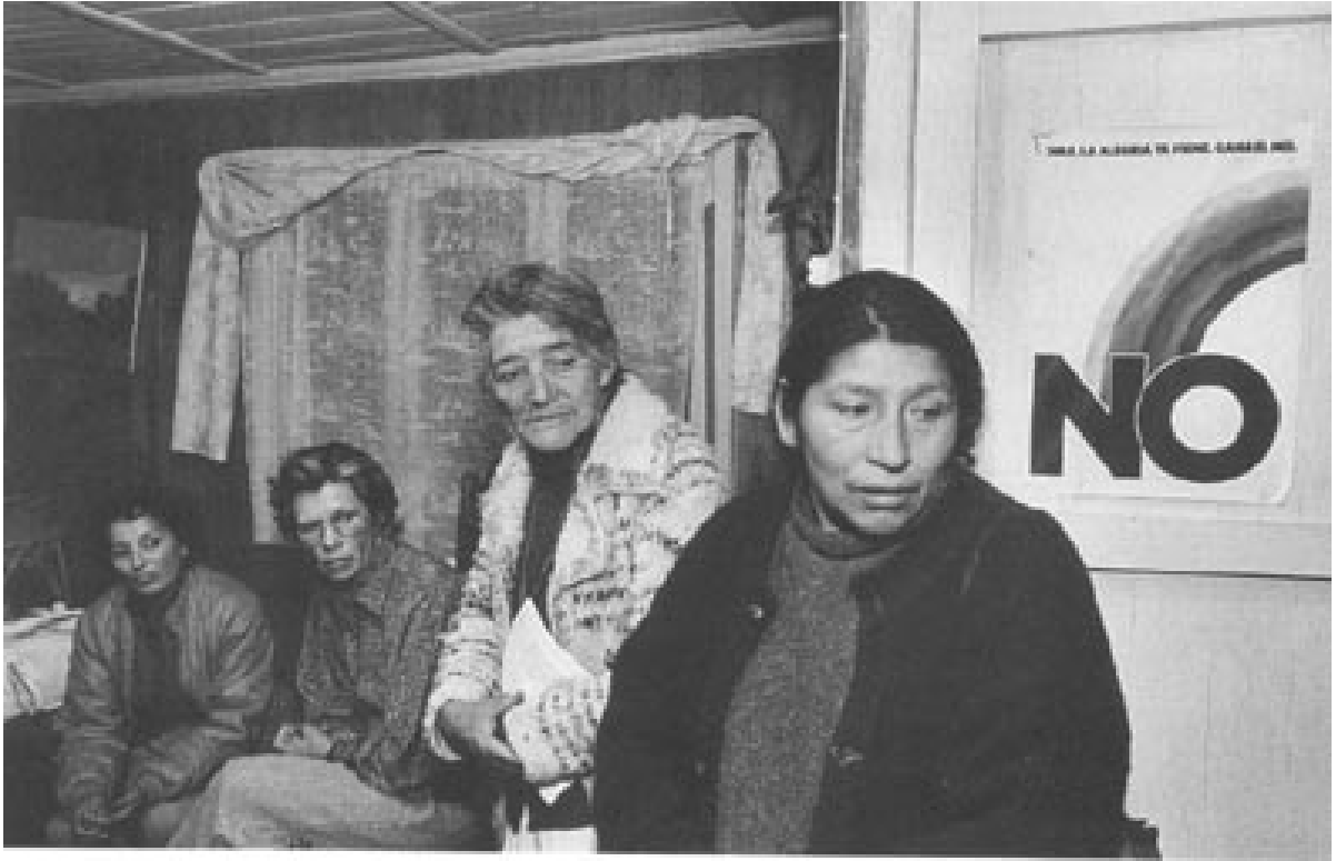
Mujeres de la Agrupación en una reunión, 1991