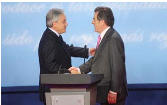
Frei y Piñera se mostraron los dientes en el primer debate presidencial.

A rebatir puntualmente el emplazamiento de Eduardo Frei a Sebastián Piñera por el uso de información privilegiada en LAN en el debate de anoche salen hoy los cercanos al candidato de la derecha que tildó de “bajeza” la mención de su rival de la Concertación.