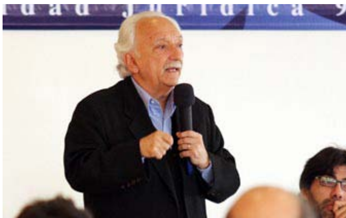
Jorge Arrate se mostró optimista: la izquierda tendrá “gran elección”.

El candidato presidencial del Juntos Podemos-Frente Amplio, Jorge Arrate , volvió a llamar a Eduardo Frei y a Marco Enríquez-Ominami a pronunciarse sobre su llamado a un acuerdo en segunda vuelta “para derrotar a la derecha”.