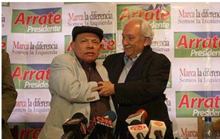
Tomás Borge saludó a Jorge Arrate en la sede de su comando.