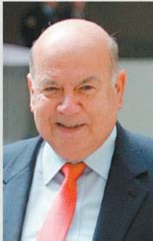
INSULZA (PS). - Definición pendiente, viene a mediados de diciembre a Chile.