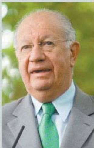
LAGOS (PPD-PS). - Dice no ser candidato, pero el PPD insiste en su nombre.