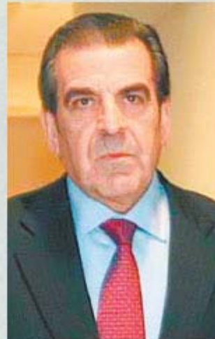
FREI (DC). - Dispuesto a primarias y espera la nominación de su partido.