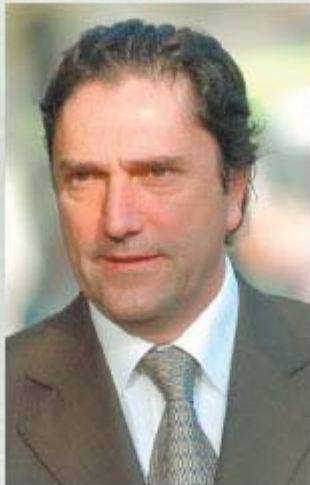
GÓMEZ (PRSD). - Su intención es mantenerse en carrera y competir en primarias multipartidarias, acota.