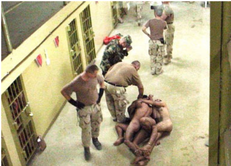
Soldados estadounidenses torturando a prisioneros en Irak.

Sin embargo esa línea de defensa ha sido desechada por los especialistas de la ONU. Estos consideran que los Estados Unidos tienen jurisdicción donde operan sus fuerzas en cualquier sitio del mundo y que están obligados a observar los textos que han ratificado en la ONU, que son inderogables y se respetan sin excepción en todo momento, lugar y circunstancias, estando absolutamente prohibida la tortura y todo otro tratamiento o castigo inhumano, cruel o degradante para prisioneros.