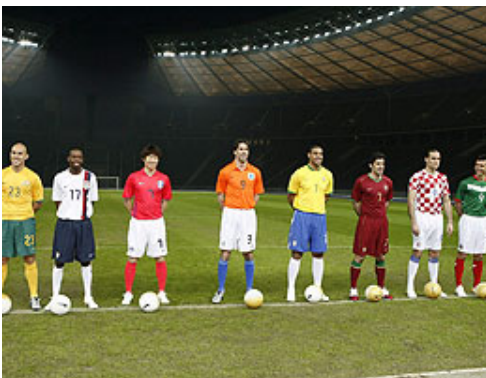
De izquierda a derecha Marco Bresciano de Australia; Damarcus Beasley de EE.UU; JS Park de Corea; Ruud van Nistelrooy de Holanda; Adriano de Brasil; Luis Figo de Portugal; Dado Prso de Croacia; Jared Borgetti de México presentando las camisetas oficiales de sus selecciones para el Mundial de Fútbol 2006 en el estadio Olímpico de Berlín.