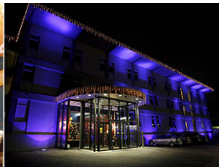
Vista exterior del Club Artemisa, el mayor prostíbulo de Alemania, en Berlín, ayer jueves 8 de diciembre. El establecimiento ofrece los servicios de 70 prostitutas que trabajan de autónomas, sin proxenetas.