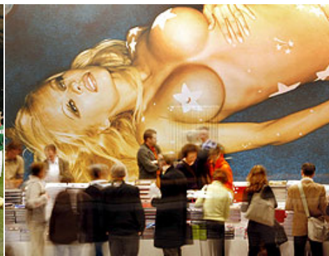
En la imagen visitantes examinan libros delante de un cartel gigante de la actriz estadounidense Pamela Anderson en la caseta de la editorial Taschen-Verlag de la feria del libro de Fráncfort, Alemania. Cuando comience el Mundial de Alemania muchas "imitadoras" de la actriz se pasarán para vender sus servicios por las principales ciudades germanas.