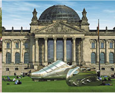
Imagen generada por ordenador que muestra una escultura gigante de dos botas de fútbol frente al edificio del Reichstag en Berlín. Las botas representan una de las cinco ideas que están siendo construidas por el fabricante de coches EDAG.

Según la Iglesia Evangélica de Alemania (EKD), la mayor comunidad protestante del país, calcula que las mafias internacionales traerán 40.000 prostitutas forzadas a Alemania coincidiendo con el Mundial de Fútbol.