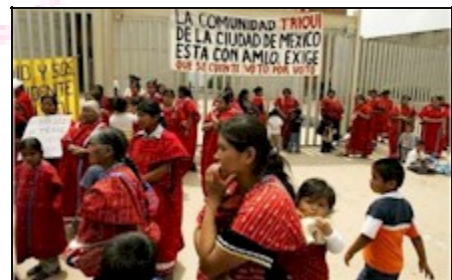
Continúan las protestas frente al Tribunal Electoral.

Discursos contra los resultados electorales del 2 de julio pasado y consignas de voto por voto, casilla por casilla, animaron a los manifestantes, quienes se vieron respaldados por personas del pueblo.