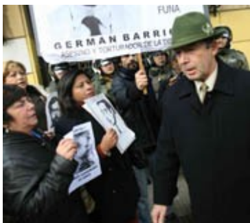
Comisión Funa acosó a oficiales retirados a la salida de la conferencia.