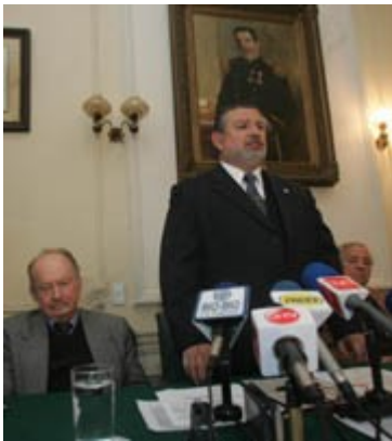
Conferencia de militares en retiro.