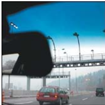
El contrato faculta a las concesionarias a enviar a los automovilistas a Dicom

Un simple llamado telefónico basta para que quienes utilizan las autopistas y no pagan la cuenta de su dispositivo, se pongan las pilas. “Es que los chilenos funcionan así, bajo amenaza”, dicen en una de ellas. Por eso, Costanera Norte y Autopista Central ya tienen a los suyos en la lista.