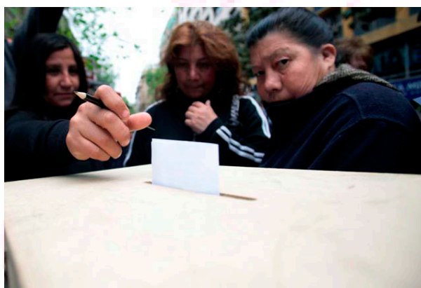
En Avenida Henríquez en Copiapó también están votando