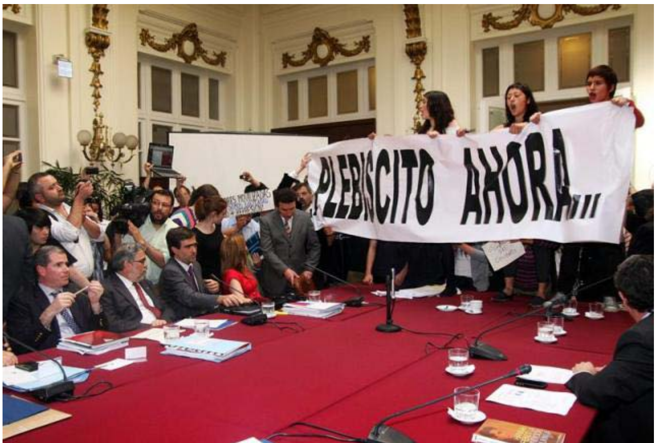
Estudiantes sobre la mesa de sesión