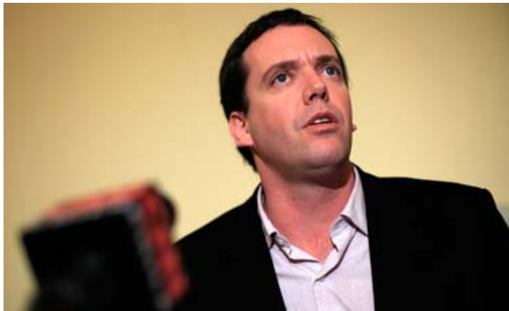
Felipe Harboe, diputado PPD.

Esta mañana el diputado y ex subsecretario del Interior Felipe Harboe (PPD) sostuvo que "me gustaría que el mismo celo y control de identidad que se hizo ahí cuando hay indicios, se haga en las manifestaciones específicamente de los violentistas, porque lo que ocurre es que este pequeño grupo violentista genera un descrédito a la movilización y eso no puede ocurrir" .