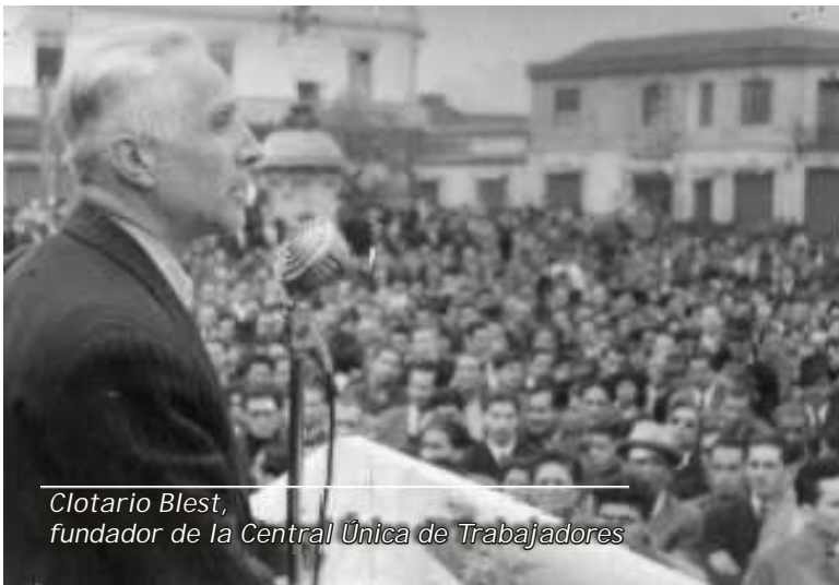
Clotario Blest, fundador de la Central Única de Trabajadores

necesario para alcanzar grados de industrialización que nos permitieran competir en el mercado mundial. Entre el '38 y el '60 se activó la vida económica urbana; sin embargo, la economía siguió teniendo un carácter primario exportador--lo que antes fue el salitre, después fue el cobre y el sector minero carbonífero.