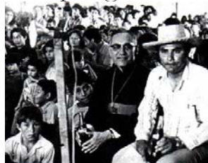
Oscar Romero Vive.